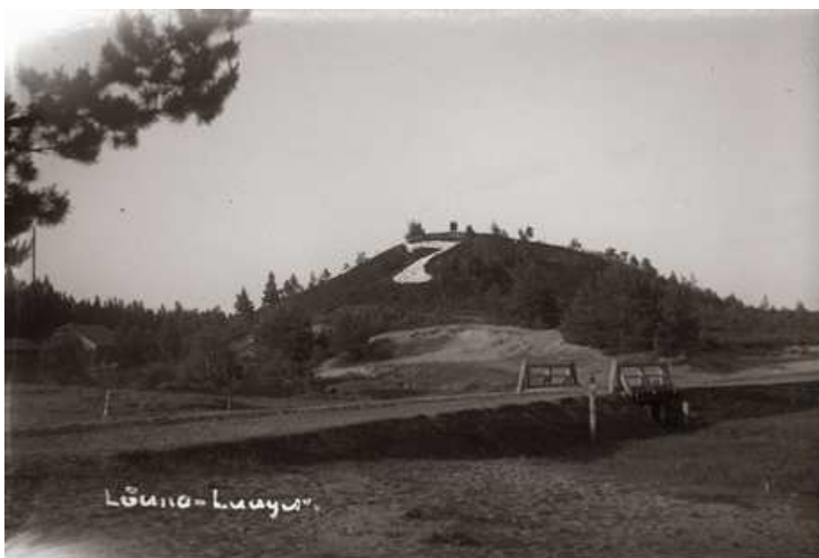
Pilt 2. Ajalooline foto Petseri Lõunalaagri Seitsmemäest koos sillaga.

Teise maailmasõja ajal kasutas Lõunalaagrit olenevalt riigikorrast nii Saksa kui Vene armee. Pärimuse järgi kujundasid 1940 aastal punaarmeeelased number 7 viisnurgaks. 1941 Petseri raudteejaama pommitamisel olid sakslased kasutanud suurt viisnurka orinetiiriks ning punaarmeeelastele anti kask valged kivid sealt laiali pilduda. Nõukogude ajal kasutas piirkonda õppusteks vene sõjavägi ning eestiaegne sõjaväelinnak hävis. Taasiseseisvumise järel on alal valitsenud vaikus ja kunagine aktiivne militaartegevus on unustusehõlma vajunud.