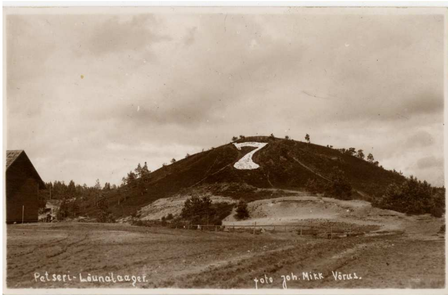
Pilt 1. Ajalooline foto Petseri Lõunalaagri Seitsmemäest.