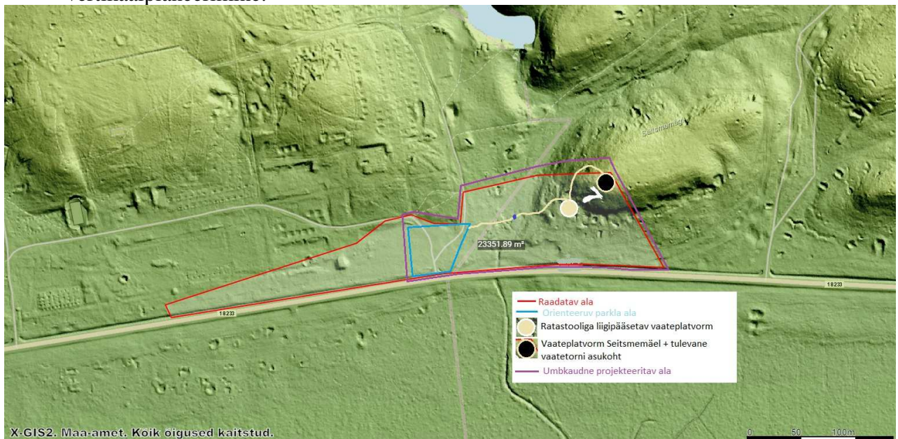
Joonis 1. Seitsmemäe kavandatav projektiala- eelprojekti lähteülesanne.

1926.-1940. aastal asus Petserimaal, Voropi ja Rääptsova küla maadel Eesti Kaitseväge suvelaager – Petseri Lõunalaager. Laager oli suviseks väljaõppekohaks Võrus ja Petseris paiknenud 7. jalaväerügemendile. Väeosa tähistamiseks rajati laagris asuvale järsule mäenõlvale hiiglaslik valgetest kividest number „7“, mis oli terve laagri sümboliks (Seitsmemägi) (pilt 1 ja pilt 2). Petseri Lõunalaagrist pole säilinud ühtegi hoonet.