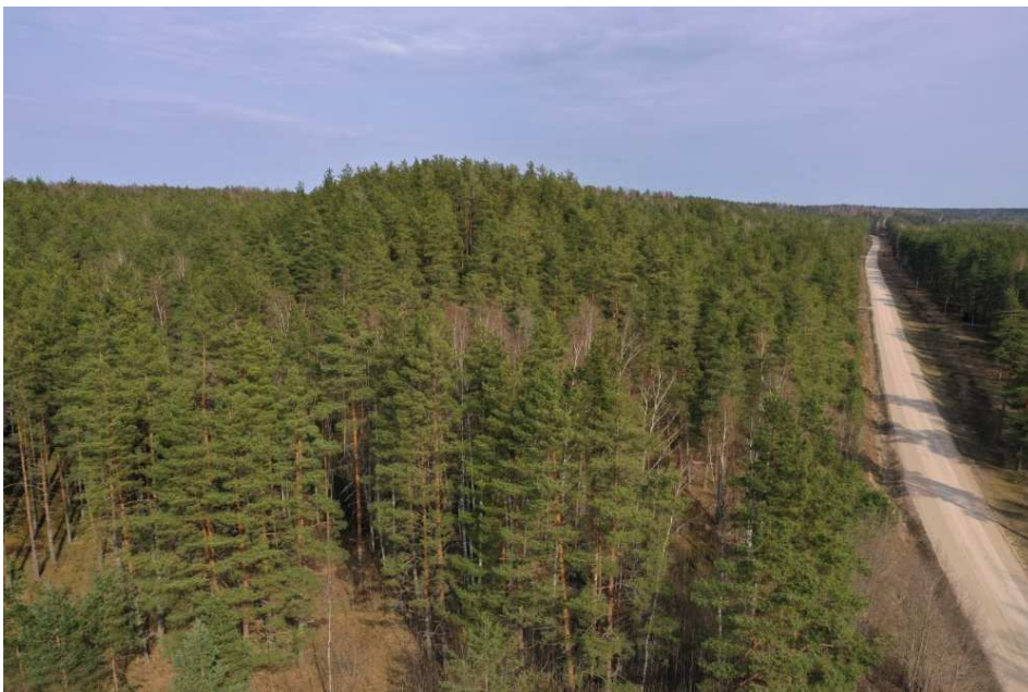
Pilt 3. Droonifoto Seitsmemäest 2021. aastal.

2010. aastal taasavastati kunagine Petseri Lõunalaager pärandkultuuri inventeerimise käigus ja RMK rajas sinna laagrit tutvustava Lõunalaagri matkaraja https://loodusegakoos.ee/kuhuminna/puhkealad/rapina-varska-puhkeala/lounalaagri-lokkekoht koos lõkkekohaga. Lõunalaagri matkarada on rajatud EV aegsele 7.nda jalaväe rügemendi laagrialale. Lõunalaagrit läbib 2012. aastal rajatud RMK Laskevälja rattarada https://www.loodusegakoos.ee/kuhuminna/puhkealad/rapina-varska-puhkeala/laskevalja-rattarada-43-km ja 2013. aastal rajatud RMK Ähijärve-Aegviidu matkatee. Laskevälja rattarada ühendab Petseri Põhja- ja Lõunalaagrit.